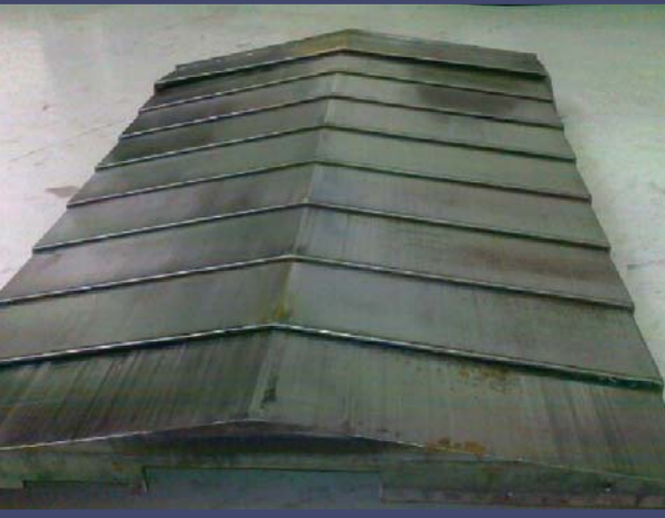
Teleskopabdeckung SEMA END 200/1