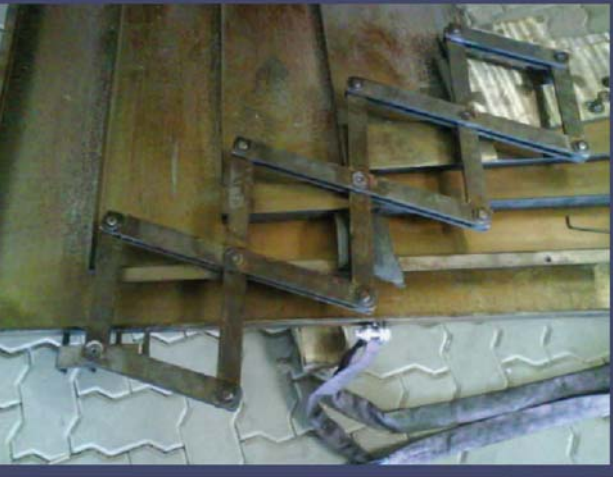
Teleskopabdeckung DMU 125 P