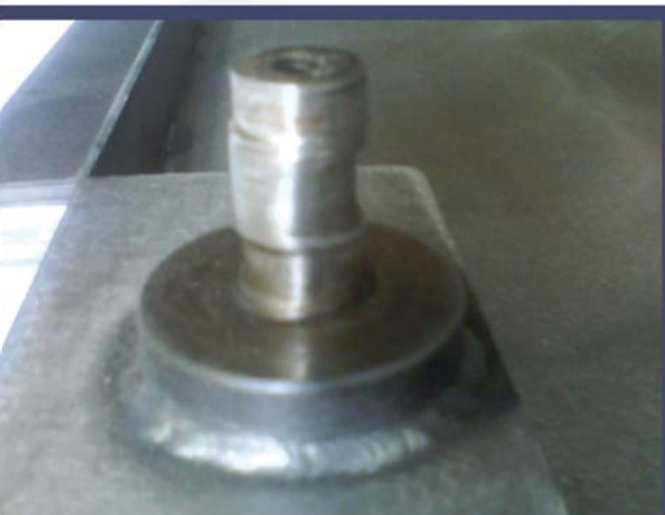
Teleskopabdeckung DMU 125 P

MAT Maschinentechnik GmbH Carl-Zeiss-Weg 7 · 38239 Salzgitter Telefon 05341.8989-40 Fax 05341.8989-44 E-Mail anfragen@mat-sz.de